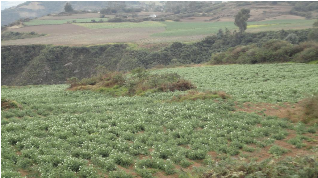
Foto 5. Plantaciones de papa cerca de Chaglla - Pachitea.

Esta unidad comprende una superficie SIG de aproximada de 176 992 ha, equivalente al 6,50% de la superficie total estudiada, en la que se desarrolla la agricultura alto andina, propio de climas templado a frígido, ambiente en el que se cultivaron 18 336 ha con diversas especies de corto período vegetativo durante la campaña agrícola 2009, con una producción de 193 995 toneladas métricas. Esta unidad esta constituida por todas las áreas cultivadas que se encuentran ubicadas por encima de los 1 800 m de altitud, perteneciente a los distritos que comparten territorio con zonas de selva y sierra. Áreas donde es factible desarrollar agricultura tropical y agricultura alto andina, entre las especies más difundidas en esta unidad figuran: “ajo”, “apio”, “arveja”, “avena”, “betarraga”, “brócoli”, “calabaza” “camerún”, “cebada”, “cebolla”, “col repollo”, “col china”, “coliflor” “chocho”, “fríjol”, “haba”, “maca”, “maíz amiláceo”, “ñuño”, “oca”, “olluco”, “papa blanca”, “papa amarilla”, “poro”, “quinua”, “trigo”, “zanahoria” y algunas especies forrajeras como: “alfalfa”, “avena “rye grass” y trébol”, como ocurre en el caso de los distritos de Arancay, Cochabamba, Chaglla, Chinchao, Cholón, Churubamba, Huacaybamba, Jircan, Marías y Pano (Foto 5).