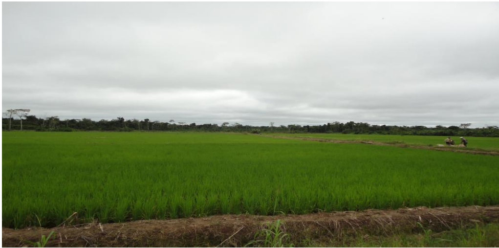
Foto 1. Plantación de arroz en el sector de Honoria. Bajo Pachitea.