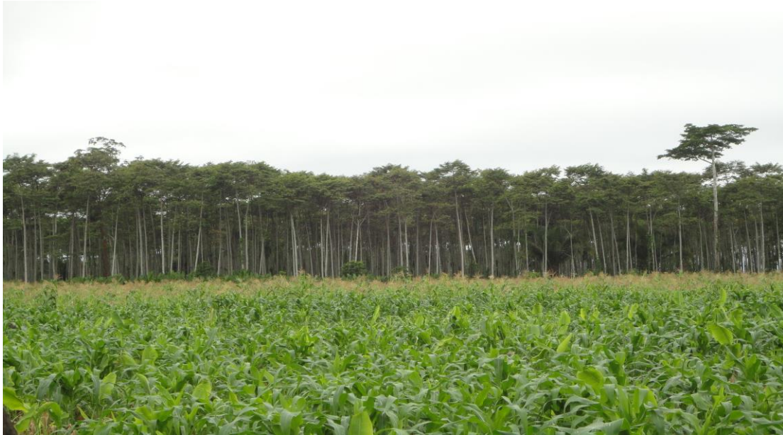
Foto 9. Plantación de “bolaina blanca” Guazuma crinita a orillas del río Pachitea - Honoria