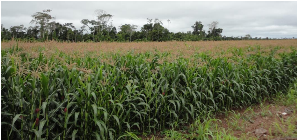
Foto 2. Plantación de maíz en Honoria Vieja. Bajo Pachitea.