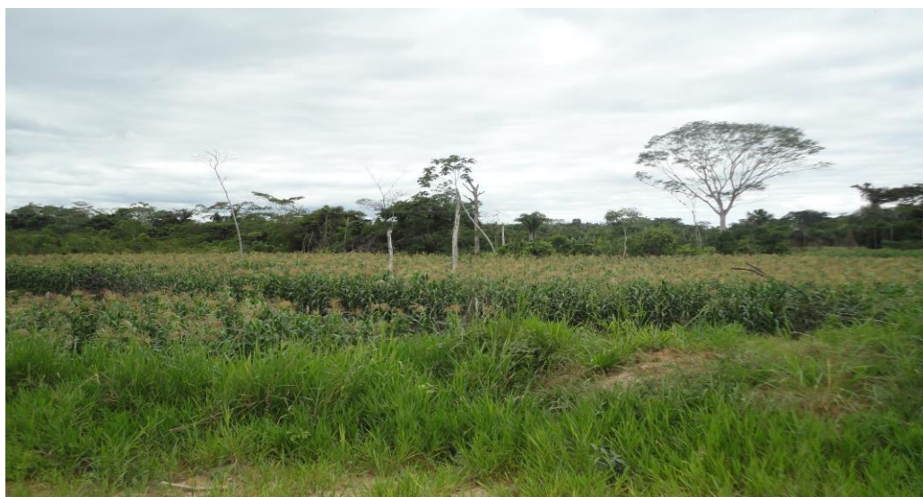
Foto 3. Plantación de maíz en el sector de Paraíso- Alto Huallaga.