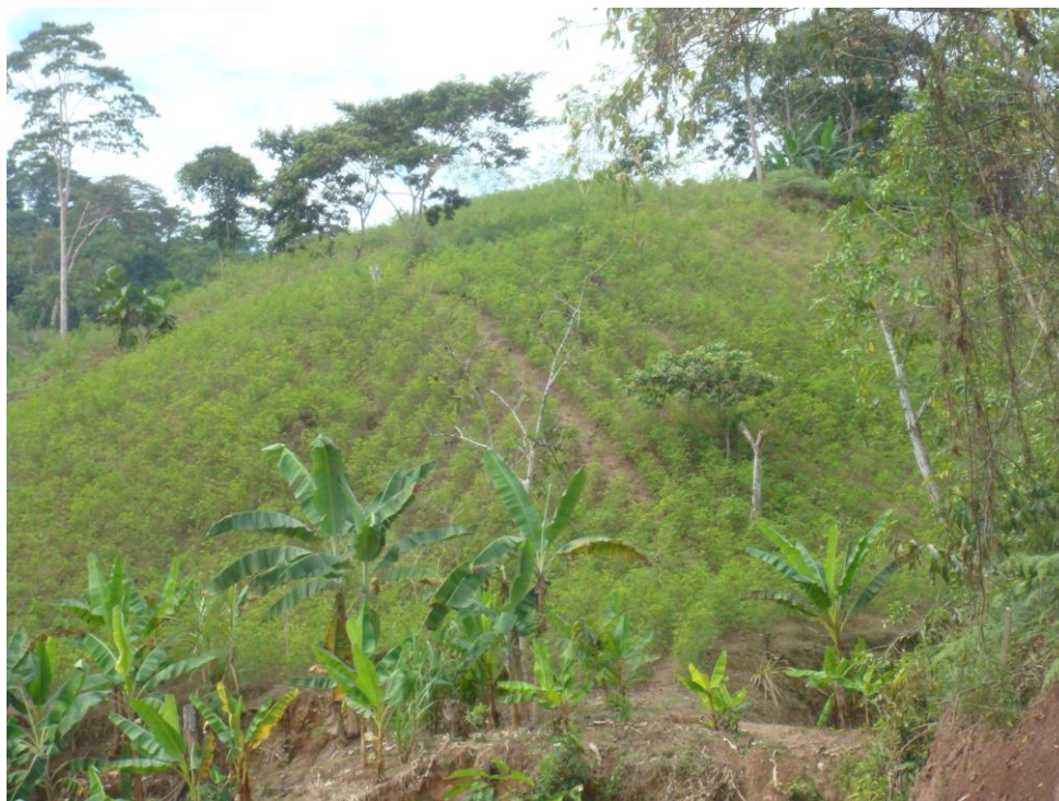
Foto 8. Plantación de coca en el valle de Monzón.

Ésta unidad cubre una superficie SIG aproximada de 85 104 ha, que representan el 3,12 % de la superficie total estudiada, cifra altamente superior a la extensión real de coca cultivada existente al año 2009 que alcanzó a 16 886 ha. En la selva del departamento de Huánuco esta unidad se distribuye principalmente en la cuenca del río Monzón, Alto Tulumayo y el divorcio de aguas en la cabecera de las cuencas de los ríos Aguaytía, Tulumayo y Zungaroyacu (Figura 1).