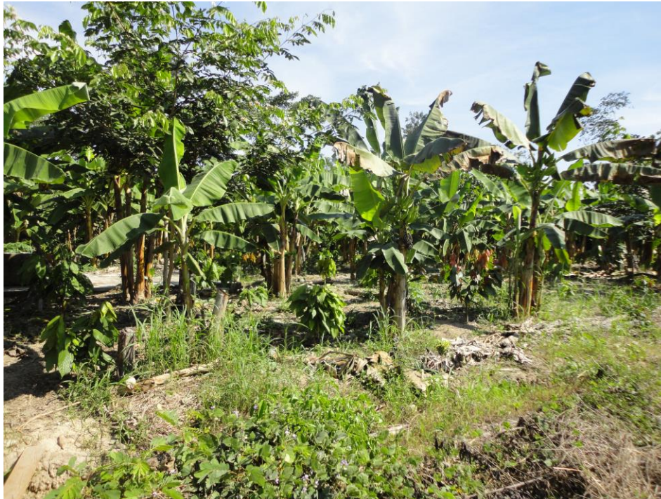
Foto 4. Plantación de plátano y cacao en el sector de Paraíso.