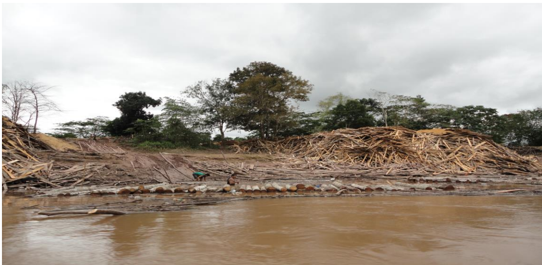
Foto 10. Aserrío de madera en el sector de Puerto Zúngaro.

Actualmente esta actividad ha disminuido considerablemente debido a que las especies maderables comerciales están a punto de agotarse y se viene efectuando programas de reforestación con especies de rápido crecimiento como la “bolaina blanca” (Foto 9), que está siendo utilizada en la fabricación de cajonería para el transporte de frutas y en la preparación de tablillas para diferentes usos (Foto 10). En la zona de estudio existen más de 1 000 ha reforestadas con esta especie.