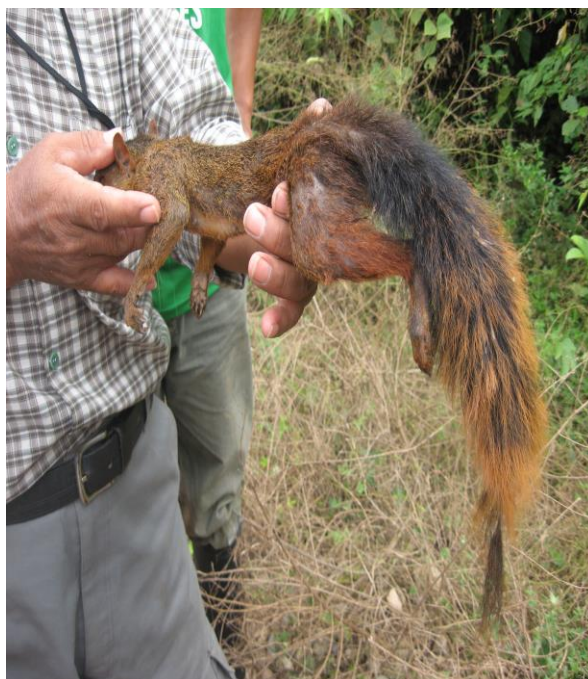
Figura 9. Ejemplar adulto de “ardilla colorada” Sciurus igniventris , muerto accidentalmente en la carretera Súngaroyacu - Pucallpa, julio 2010

Además, la mayoría de estas especies generalmente no son cazadas ni para el consumo de subsistencia debido a su pequeño tamaño como la “punchana” ( Myoprocta pratti ) y “manacaraco” ( O. guttata ). Para esta categoría fueron diferenciadas 14 especies: 9 mamíferos, 4 aves y 1 anfibio (Anexo 2), la mayoría de ellas son componentes de la comunidad residual. Entre las más representativas para esta categoría se encuentran el “añuje” Dasyprocta variegata y D. fuliginosa , “punchana” Myoprocta pratti , “carachupa” o “quirquincho” Dasyopus novemcinctus y D. kappleri , “fraile” Saimiri boliviensis , “pichico boca blanca” Saguinus fuscicollis (Figura 8), “zorro” o “muca” Didelphis marsupialis y D. albiventris , “conejo silvestre” Sylvilagus brasiliensis , “ardilla colorada” Sciurus igniventris (Figura 9) y “ardilla negra” Microsciurus oscura .