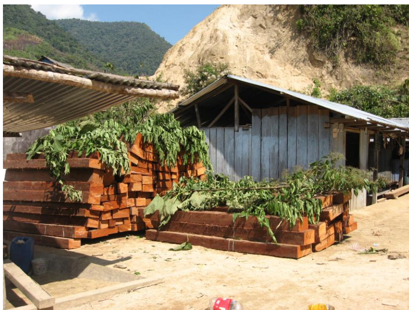
Figura 10. Alteración de hábitats por extracción de madera entre ellos el “cedro” Cedrela odorata en bosques circundantes a la localidad de Galilea (río Chonta yacu), julio, 2010.

La deforestación del bosque también tiene mucho que ver con las concesiones forestales otorgadas en el curso superior y cabeceras de los ríos Yanajanca y Frejol. En efecto, en abierta contracción a los dispositivos legales de prohibición de tala de árboles en cabeceras de cuencas se estarían extrayendo madera del sector antes mencionado ocasionando serias alteraciones a los escasos hábitats para la comunidad de fauna primaria, cuya reducción afecta más al “choro cola amarilla” O. flavicauda , por tratarse de una especie endémica y por ende su distribución geográfica es muy restringida.