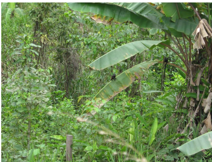
Figura 8. Ejemplar adulto de “pichico boca blanca” Saguinus fuscicollis forrajeando en campo de cultivo (carretera Súngaroyacu - Pucallpa), julio 2010.