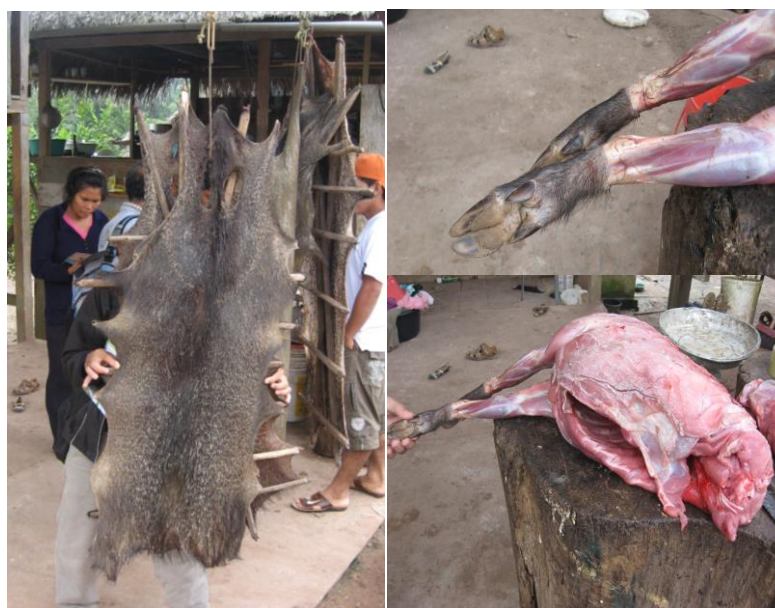
Figuras 4, 5 y 6. Despojos de “sajino” Pecari tajacu cazado en bosques del río Shebonya (km 41 de la carretera Súngaroyacu - Pucallpa), julio 2010.

Común (C): Agrupa especies cuyas poblaciones son abundantes, por lo que a menudo son observadas dentro del bosque e incluso en las chacras abandonadas y pastizales, así como en las playas y bosque ribereño. La mayor abundancia de estas especies se debe entre otros factores a la fácil adaptación a diferentes condiciones ambientales, entre ellas la presión de caza y fuertes alteraciones de su hábitat, donde han encontrado suficientes recursos alimenticios y escasos competidores en el espacio vertical y horizontal.