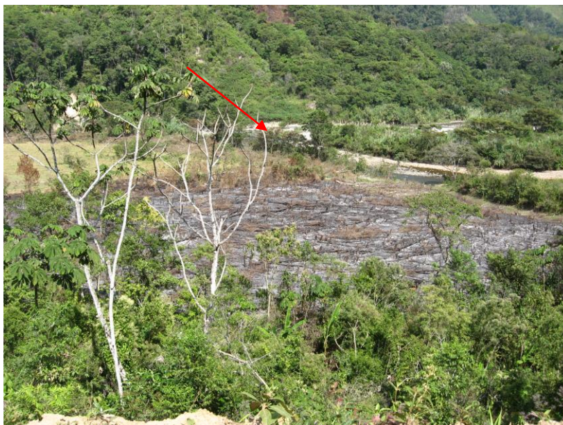
Figura 2. Destrucción del hábitat del “choro cola amarilla” O. flavicauda por tala y quema del bosque en Cocalito, río Chontayacu, julio, 2010.

especies mencionadas fueron observadas de manera directa como el “machetero o carrón” (Figura 3) y el “guacamayo amarillo y azul” en la carretera de Pozuzo a Codo de Pozuzo