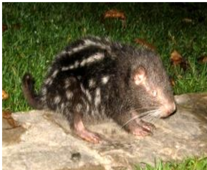
Figura 3. Ejemplar juvenil de “machetero o carrón” Dinomys branickii , observado por uno de los especialistas en la ruta Pozuzo - Codo de Pozuzo, julio, 2010.