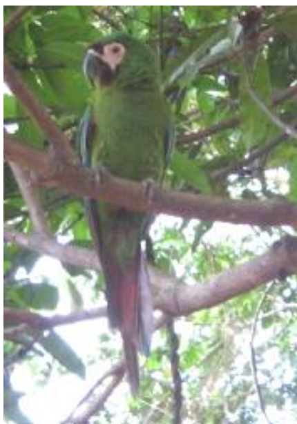
Figura 7. Ejemplar adulto de “guacamayo verde” Ara severus observado muy cerca a Codo del Pozuzo, julio 2010.