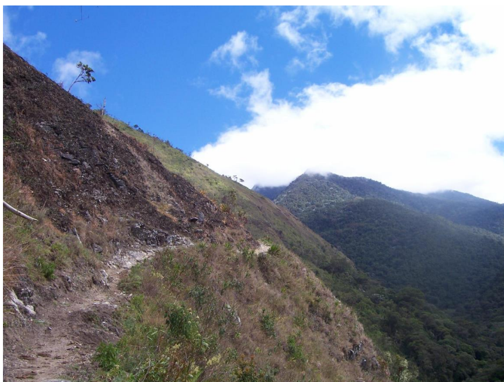
Foto 05. Sector de comunidades altoandinas mixtas de herbáceos con matorrales densos y árboles dispersos (con parche quemado).

Basada en la referencia bibliográfica de Young y León (1988).