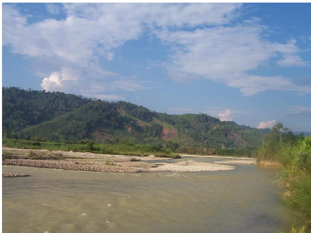
Foto 02. Aspecto de bosque de colinas altas (bosque remanente cerca de Almendras).

Inventario rápidos de reconocimiento en bosques remanentes, de los Sitios N° 7 (Nuevo Oriente, UTM X = 363484, Y = 9051878, tabla A-5.7), N° 10 (Santo Domingo de Espino, UTM X = 330 204, Y = 9072888, tabla A-5.10), y N° 17 (Shapaja, UTM X = 352537, Y = 9084130, tabla A-5.17).