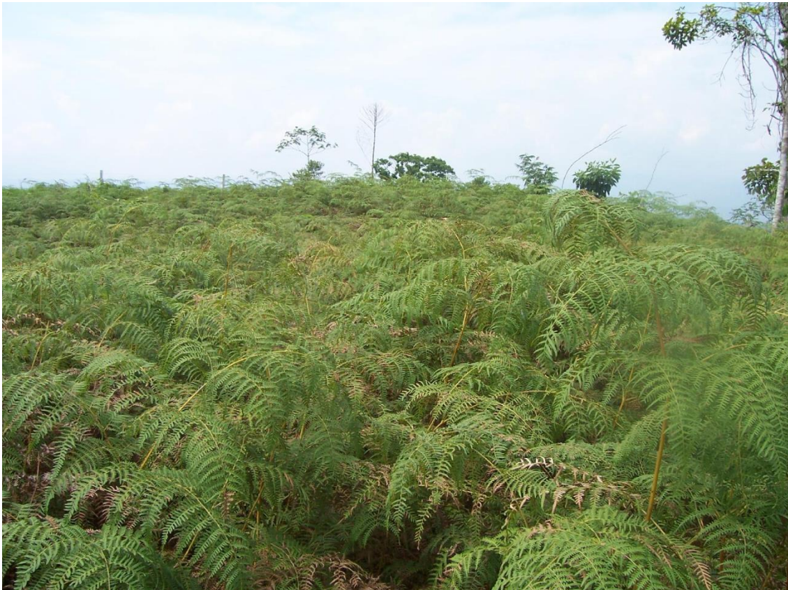
Foto 06: Vegetación secundaria con invasión de Shapumba ( Pteridium aquilinum ).

de plátano tienden a homogenizar la estructura y composición de la cobertura vegetal. En la amplitud del valle, en las partes planas y onduladas se incrementa el cultivo del arroz en pozas. Sin embargo entre los ríos Tocache y El Espino destacan las plantaciones de palmera aceitera ( Elaeis guianensis ). La práctica de la quema subsiste, con huellas en las montañas bajas o altas con vegetación tipo matorral, donde en los últimos años los colonos han introducido la ganadería, transformándolos en las actuales sabanas de "shapumbales" (con dominancia de Pteridium aquilinum ) y "cashaucshales" ( Imperata af. cylindrica ).