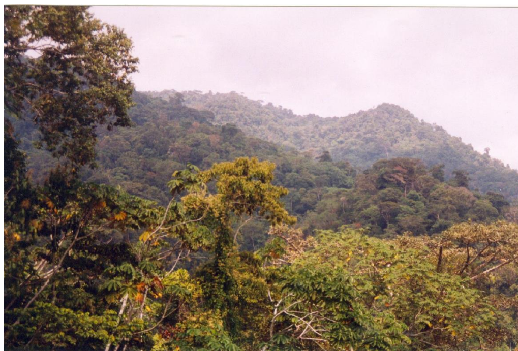
Foto 3. Bosques subandinos de montañas altas intercolinosas con árboles grandes y vigorosos

Reconocimiento: Sitio N° 01. (Alto Mantención, bosque remanente, UTM X = 343 471, Y = 9 091 652, tabla A-5.1).