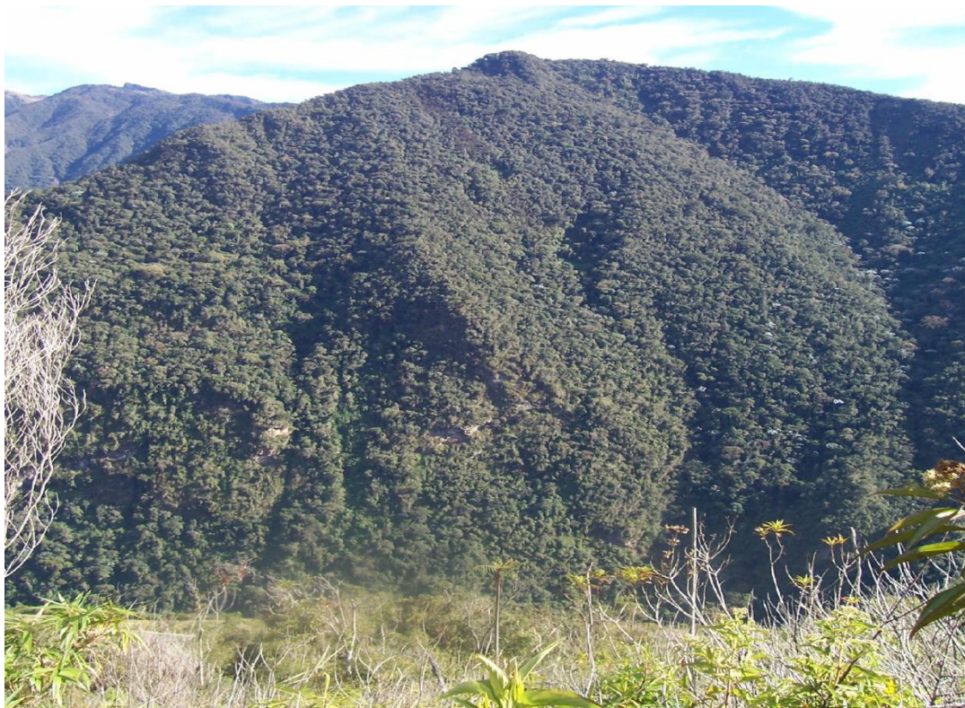
Foto 04: Bosques altoandinos de montañas altas con árboles medianos (80 Shunte).