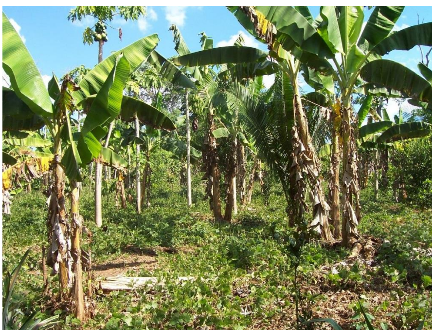
Figura 3. Vista de una "chacra" típica de cultivo de subsistencia

Según información de la Oficina de Información de la Región Agraria de Madre de Dios, la población de ganado vacuno al término del 2007 ascendió a 48.256 cabezas, de las cuales el 66% se concentra en la provincia de Tambopata; la saca anual bordea las 8.000 cabezas. Por lo general la gran mayoría de predios agropecuarios cuentan además del pasto, con pequeñas áreas dedicadas a la agricultura de subsistencia en base al cultivo de plátano, yuca, maíz, menestras y frutales; algunas veces también siembran Arroz en seco.