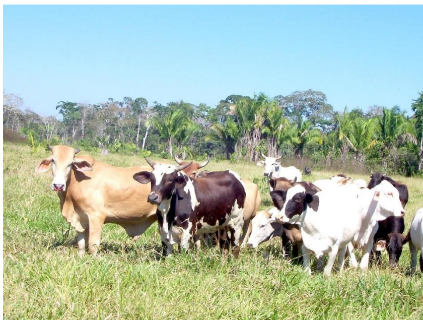
Figura 2. Vista de la calidad de ganado en Madre de Dios

Según información de la Oficina de Información de la Región Agraria de Madre de Dios, la población de ganado vacuno al término del 2007 ascendió a 48.256 cabezas, de las cuales el 66% se concentra en la provincia de Tambopata; la saca anual bordea las 8.000 cabezas. Por lo general la gran mayoría de predios agropecuarios cuentan además del pasto, con pequeñas áreas dedicadas a la agricultura de subsistencia en base al cultivo de plátano, yuca, maíz, menestras y frutales; algunas veces también siembran Arroz en seco.