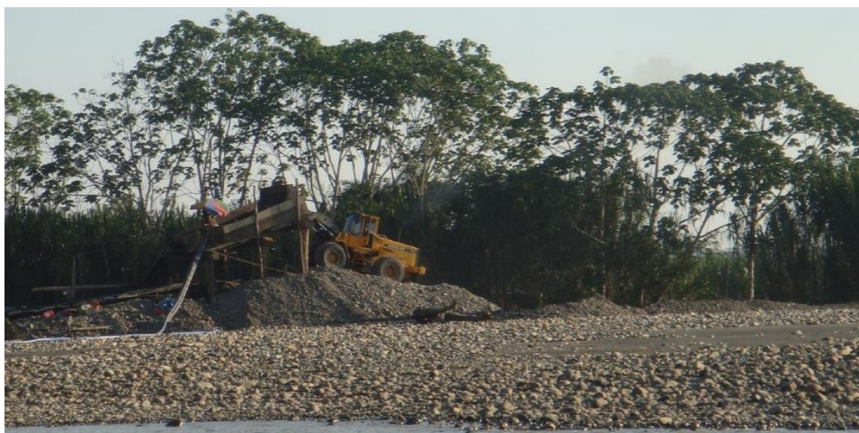
Figura. 5. Extracción de materiales usando maquinarias

La tecnología más difundida en esta actividad constituye el lavado artesanal, que es empleado tanto por los pequeños productores mineros como por los productores artesanales; los primeros utilizando maquinaria pesada: tractores de oruga, retroexcavadora, cargador frontal, volquetes y potentes motobombas para elevar el agua de sus propios reservorios construidos a más 40 metros de profundidad y los artesanales generalmente usan balsas con draga, tolva y motobomba para remover material sedimentario de los lechos de ríos y quebradas y los que trabajan en orillas y playas utilizan rampas con tolva y motobomba para el abastecimiento de material con carretilla.