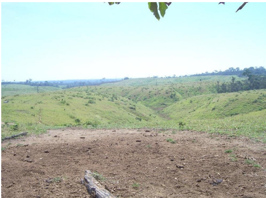
Figura 1. Vista de un pastizal extenso sin ganado pastando

Esta unidad abarca una extensión aproximada de 262.058 ha, equivalente al 3.08 % de la superficie total estudiada. Conformada predominantemente por terrazas plano onduladas distribuidas a lo largo de la carretera Transoceánica sur y sus ramales secundarios, principalmente entre el kilómetro 343 y la Ciudad de Iñapari. Áreas donde se observan gran cantidad de predios con pastizales en buen estado pero con poca cantidad de ganado y algunas veces sin la presencia de ganado alguno, como se observa en la figura 1. Es frecuente observar que cerca a los pastizales existan pequeñas áreas con cultivos agrícolas asociados que sirven de subsistencia a la familia encargada del cuidado del predio.