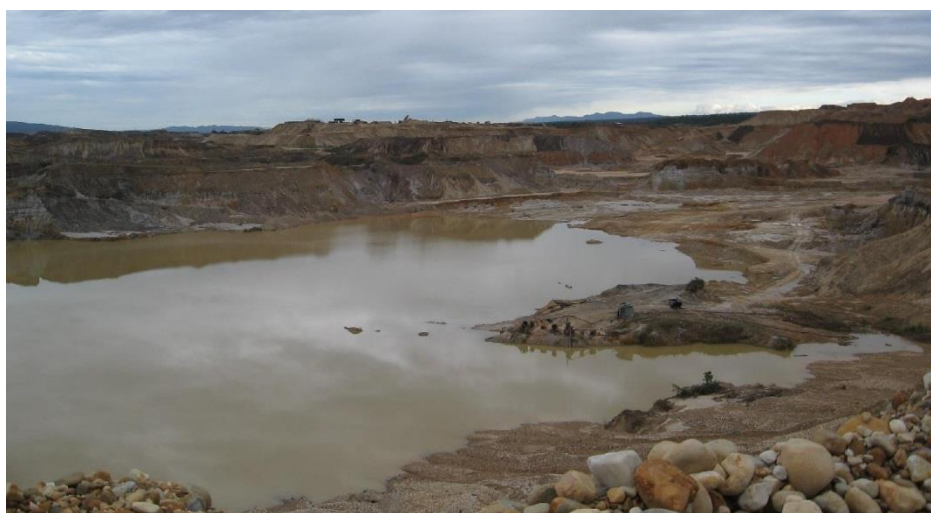
Figura. 4. Colmatación de aguas producido por la minería

La minera en Madre de Dios básicamente está sustentada en la pequeña minería y la minería artesanal de Oro aluvial. Actividad que utiliza masiva y abundante mano de obra, convirtiéndola en una fuente generadora de empleo. Los pequeños productores mineros son aquellos que bajo cualquier título poseen hasta 2.000 ha entre denuncios, petitorios y concesiones y tienen una capacidad instalada para beneficiar hasta 350 toneladas métricas o 3.000 m 3 de material diario. Mientras que, los mineros artesanales son aquellos que se dedican como medio de sustento al beneficio directo de minerales con métodos manuales, pueden conducir bajo cualquier título hasta 1.000 hectáreas y tienen capacidad para procesar hasta 25 toneladas métricas ó 200 m 3 de material diario. La condición de pequeño productor minero o de productor minero artesanal, debe acreditarse ante la Dirección General de Minería mediante Declaración Jurada bienal.