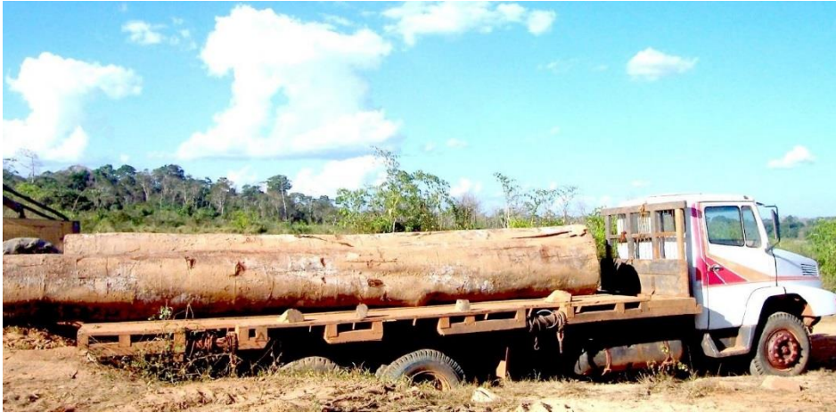
Figura. 4. Transporte de madera "blanca" en el sector de Alerta

Esta unidad se distribuye principalmente a ambos lados de carretera Transoceánica Sur y sus ramales secundarios construidos por los propios extractores para el transporte principalmente de madera rolliza. Entre las especies que más se movilizan para su comercialización figuran: el Tornillo, Moena, Shihuahuaco, Estoraque, Quillobordon, Lupuna, Cedro y Caoba; estas dos últimas se extraen de lugares cada vez más distantes del eje de la carretera.