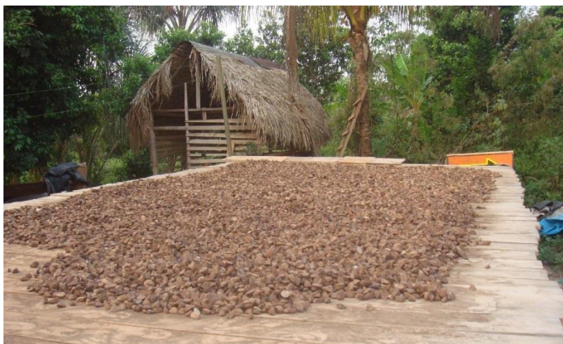
Figura. 5. Secado de la semilla de castaña

Esta unidad abarca una extensión aproximada de 583.526 ha, que representan el 6.85 % de la superficie total estudiada. Conformada exclusivamente por tierras cedidas en concesión a colonos residentes en la zona para el manejo y aprovechamiento de los rodales naturales de Castaña, especie que crece en forma espontánea en diversas áreas del departamento, cuyos frutos producen una nuez rica en ácidos grasos, que constituyen un alimento muy apreciable tanto para la población nacional como internacional. Los bosques naturales de Castaña están concentrados mayormente en el sector Puerto Maldonado - Iberia, en la zona fronteriza peruano - boliviana, en ambos lados de la carretera Transoceánica sur. La repoblación, recolección, beneficio y comercialización de frutos de la Castaña constituye una actividad económica que da ocupación a un gran número de familias, faena que les representa aproximadamente ocho meses de trabajo al año.